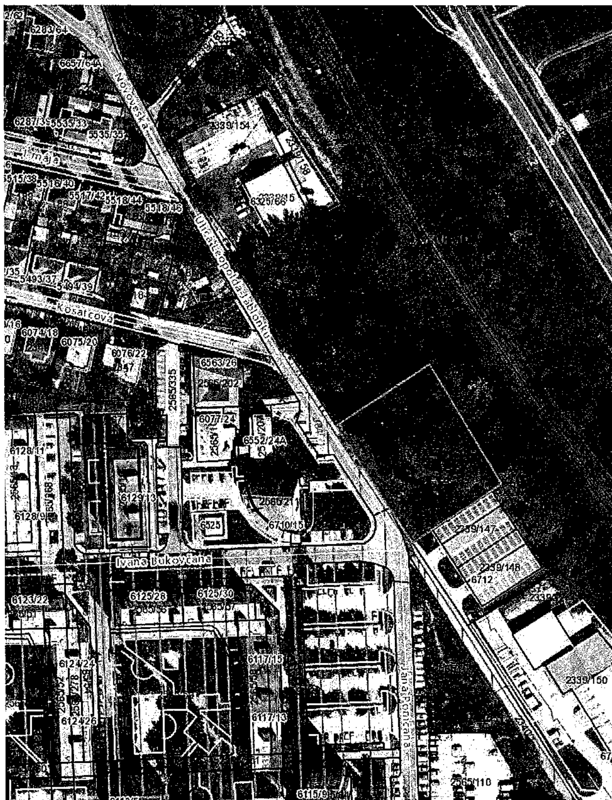
Parcela č. 2339/160