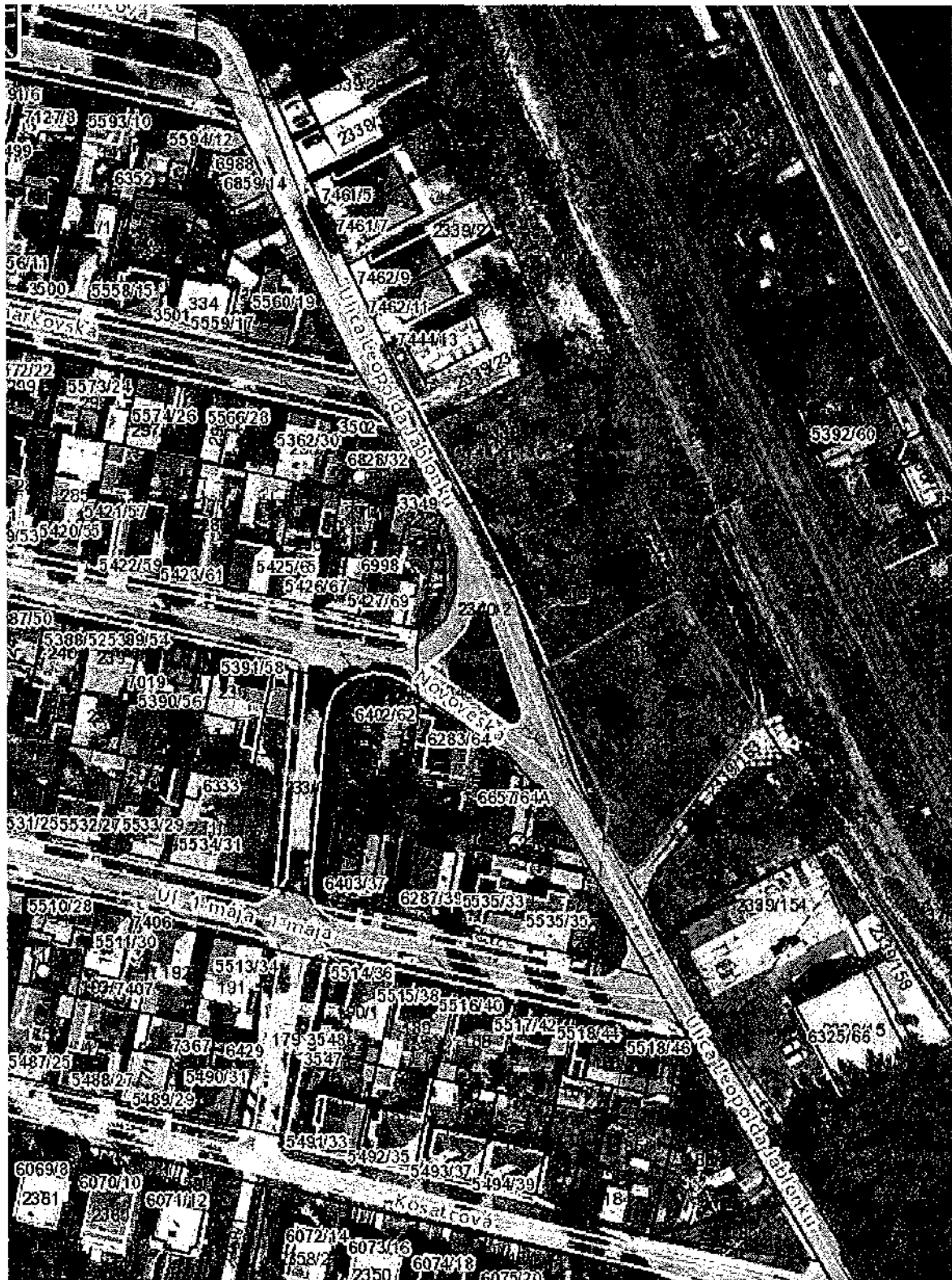
Parcela č. 2339/159