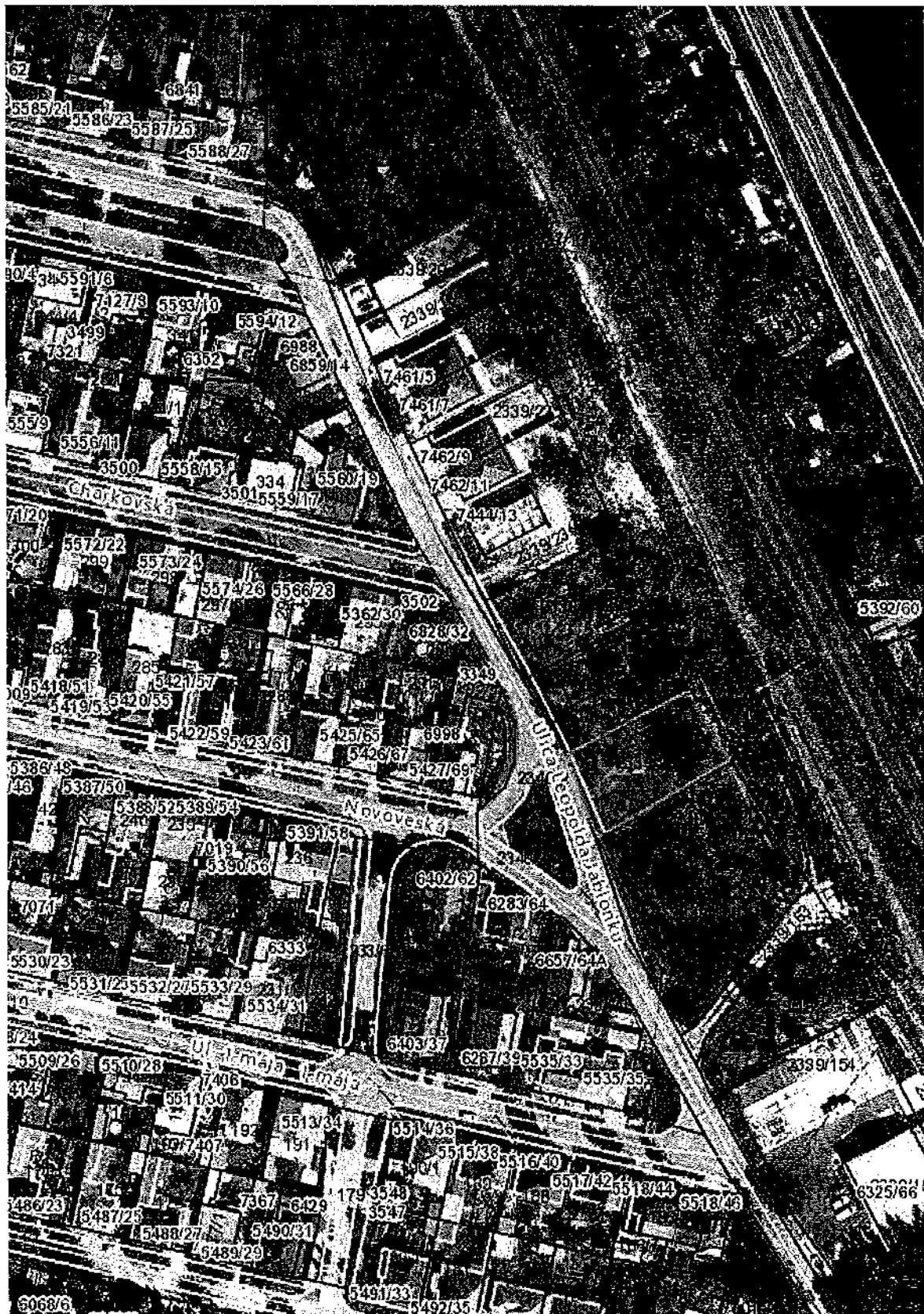
Parcela č. 2339/26