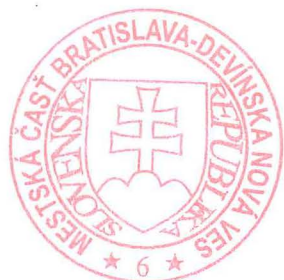
Dárius Krajčír starosta mestskej časti Bratislava Devínska Nová Ves