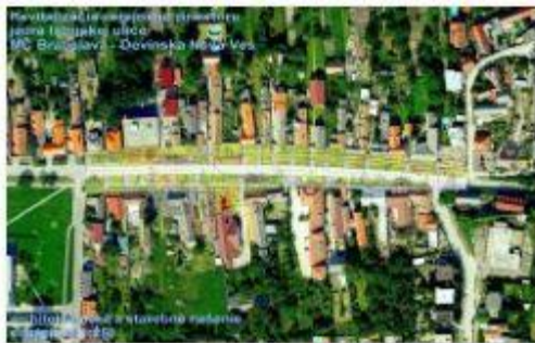
rev istr-1 perok.jpg

Zámerom tohto projektu je urgentná revitalizácia značne zdevastovanej časti Istrijskej ulice tak, aby poskytovala primeraný životný štandard pre obyvateľov aj návštevníkov obce a zároveň výraznou mierou prispela k zatraktívneniu centrálnej zóny obce.