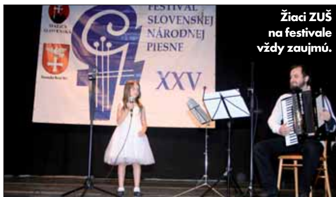
Žiaci ZUŠ na festivale vždy zaujmú.