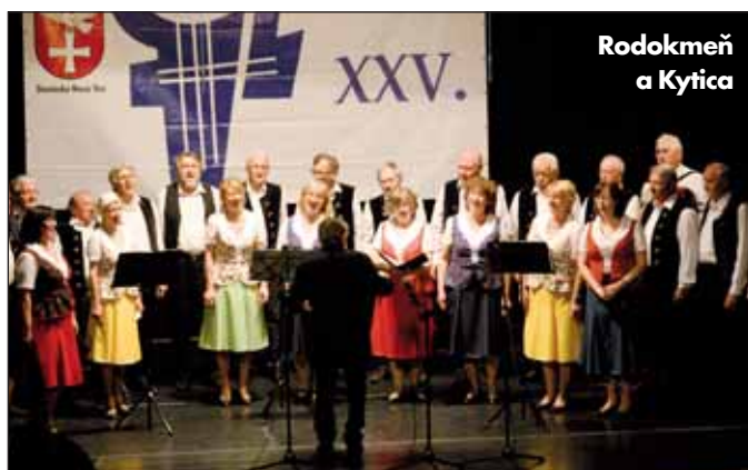
Rodokmeň a Kytica