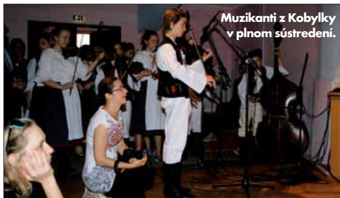
Muzikanti z Kobylky v plnom sústreďení.